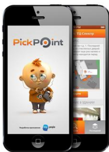
Android / iOS